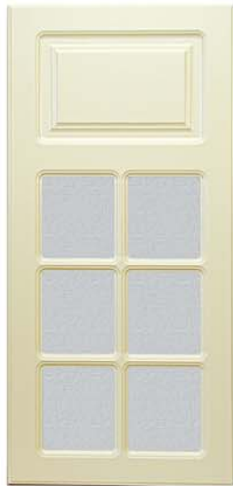
Classic Kombi Vitrin