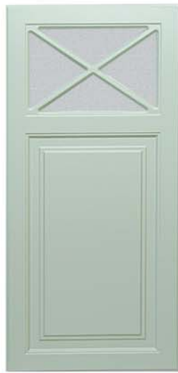
Värö Kryss Vitrin Över Spegel