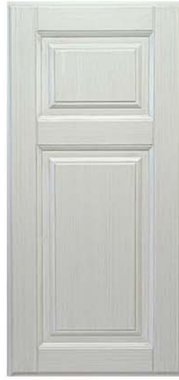
Backa Kombi lasyr