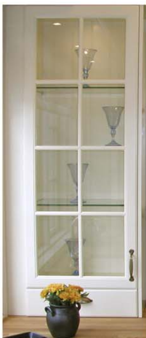
Specialskåp på bänk