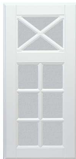
Backa Kryss Vitrin